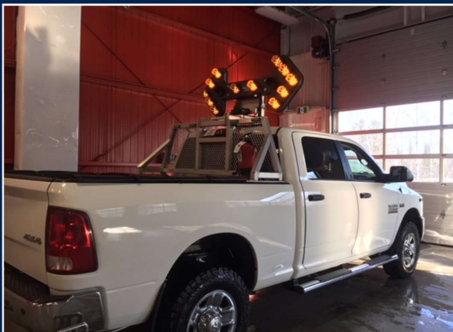
Dodge Ram 2500 - signalisation