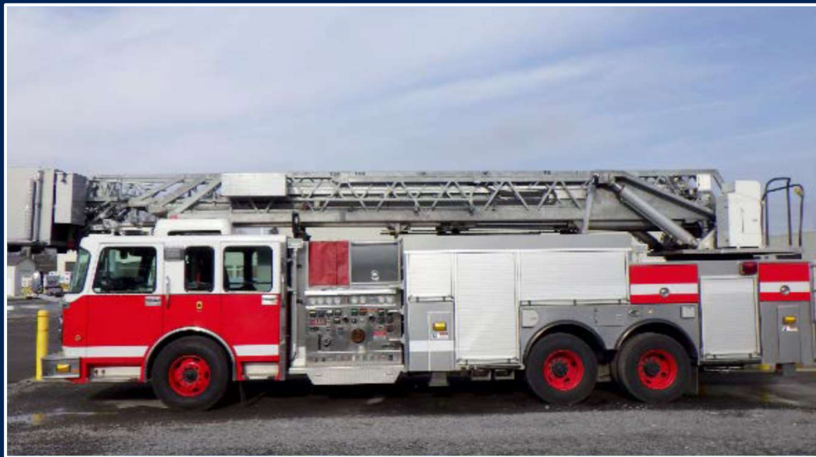
Camion-échelle Rosenbauer (en processus d'achat)